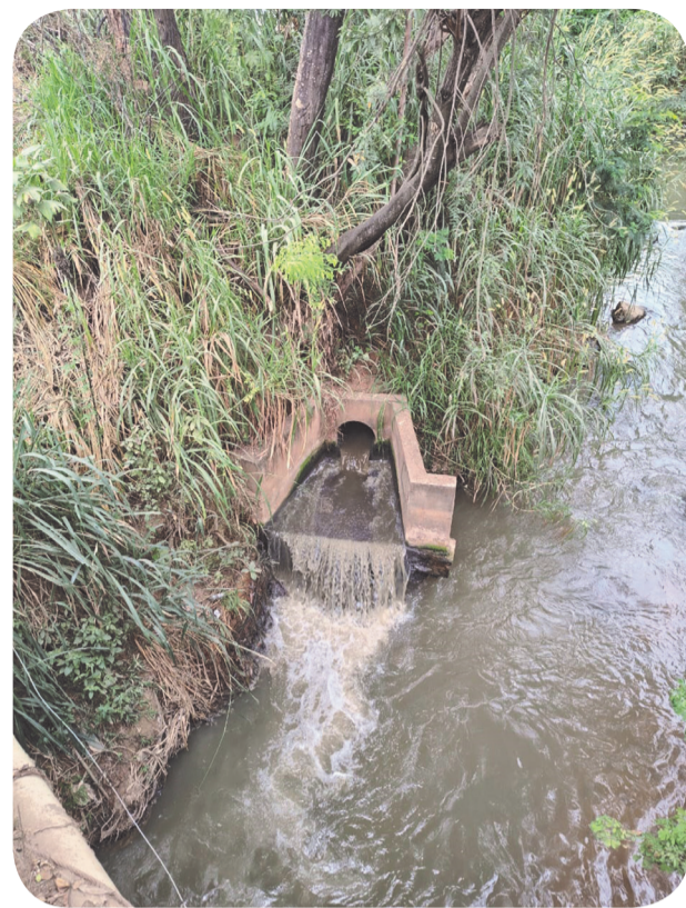
Galeria da estação elevadora de esgoto da Copasa polui o Rio Caratinga

O parágrafo 03 do 3º artigo da Lei 2.499 estabelece que a cobrança da Taxa de esgoto em 100% do valor da tarifa de água só poderá ocorrer após a integral implantação de todo o sistema de coleta, processamento e tratamento do esgotamento sanitário. Como é público e notório, naquele momento, a Copasa não ha-