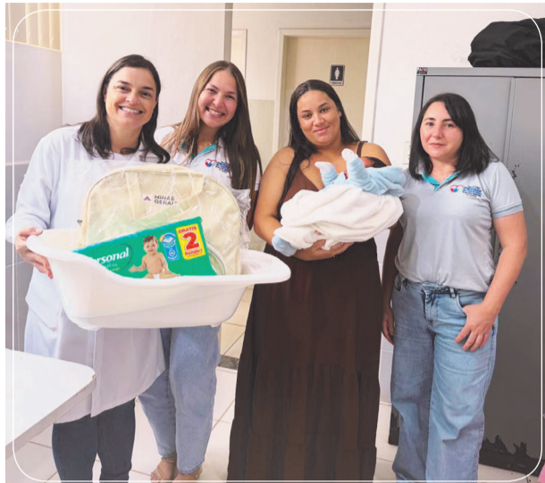
As gestantes são beneficiadas pelo programa Filhos de Minas