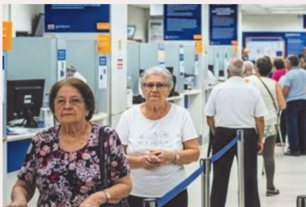
A medida visa priorizar os idosos mais velhos nas filas de atendimento

Como informa o Governo do Estado, a nova