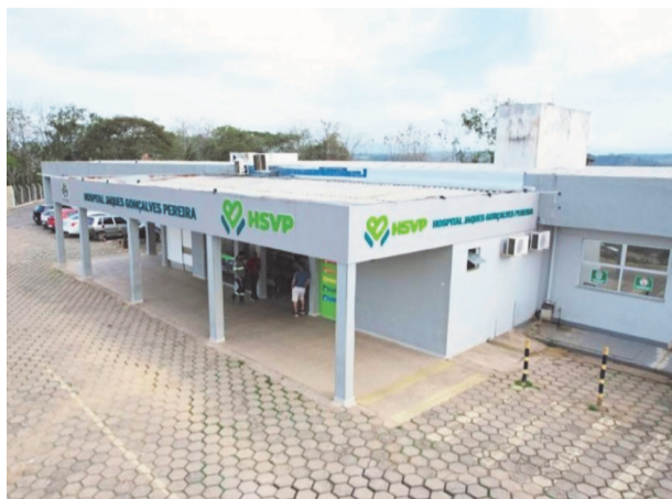
Hospital de Belo Oriente realizou mais de cinco mil cirurgias em 2025

O programa Opera Mais/PMAE foi criado com o objetivo de ampliar o acesso da popula-