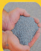
PÓ DE PEDRA