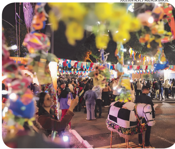
A Cemig orienta a tomada de todos os cuidados em eventos em áreas abertas

Nesse período, é comum que os espaços públicos, escolas, praças, bares e áreas comunitárias recebam decoração especial, sistemas de iluminação, tendas, barracas, palcos, estruturas de som e imagem para transmissão das partidas da Copa do Mundo. Como enfatiza a Cemig, é fundamental que ocorra um planejamento adequado das instalações elétricas, evitando que ocorram problemas, reduzindo o risco de acidentes.