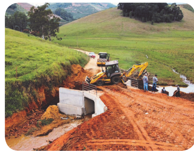
A ponte facilitará a circulação da população das localidades daquela região