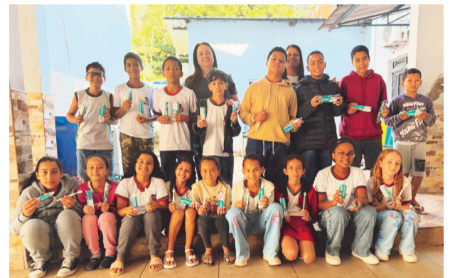
A iniciativa ensina aos alunos a importância da saúde bucal desde cedo

Segundo o prefeito de Bom Jesus do Galho, padre Anibal Borges, a iniciativa atende ao seu plano de governo. “A nossa gestão, por meio desta e de outras iniciativas, está sendo fiel aos