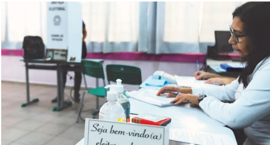
O mesário age para o perfeito funcionamento do processo de votação

Vale ressaltar que o cadastro voluntário não significa convocação imediata como mesário. Caso não haja vaga disponível, o cadastro fica guardado para futuras eleições. O interessado que for selecionado será informado por meio de uma carta convocatória oficial da Justiça Eleitoral. O documento disponibilizará detalhes como a função a ser desempenhada, além das datas e locais tanto do treinamento quanto do pleito. Muitos tribunais enviam a convocação de forma di-