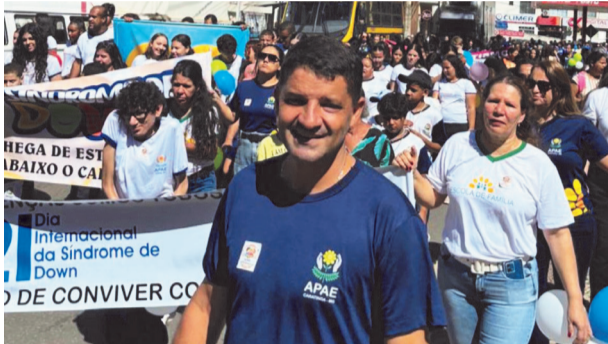
Os alunos da Apae sempre participam de desfiles cívicos