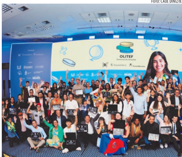
Cerimônia de Premiação da edição de 2025 da Olitef

Segundo a organização da OLITEF 2026, até agora, apenas 694 escolas mineiras confirmaram adesão, o que corresponde a 11,7% das instituições habilitadas. Entre instituições inscritas, 74 estão em Belo Horizonte e 26 em Contagem, cidades que concentram o maior número de registros. Em 2025, Minas Gerais ficou em 2º lugar entre os estados com maior número de escolas inscritas.