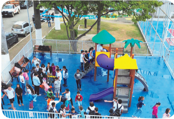
Crianças e adultos já desfrutam dos benefícios das áreas de lazer

Durante a última semana, a Prefeitura de Ubaporanga inaugurou duas novas áreas de lazer no município, reforçando os investimentos da atual gestão em qualidade de vida e locais de convivência social para a população. Com investimento de recursos próprios, a atual administração municipal entregou novos parquinhos infantis instalados nas praças Virgílio da Silva Resende e João Ribeiro, beneficiando principalmente crianças e