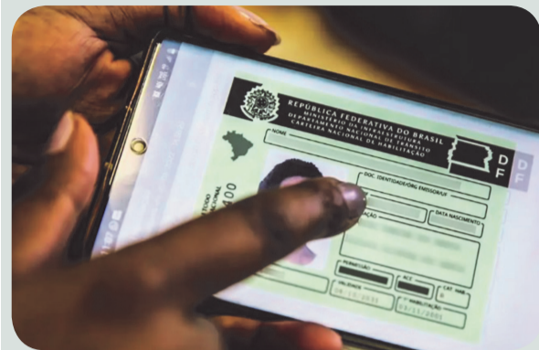
Nova proposta promete facilitar a vida dos motoristas que mantêm bom histórico no trânsito

O Senado Federal aprovou o projeto que cria a renovação automática da Carteira Nacional de Habilitação (CNH) para motoristas cadastrados no Registro Nacional Positivo de Condutores, conhecido como Cadastro do Bom Condutor. O texto segue agora para sanção do presidente Luiz Inácio Lula da Silva.