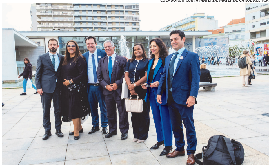
COLABOROU COM A MATÉRIA: MATÉRIA: CAROL ALENCAR

A presença de Ipanema em Portugal também terá desdobramentos durante a 16ª Festa do Queijo, que será realizada de 3 a 6 de junho. Prefeitos e representantes de Portugal virão ao município