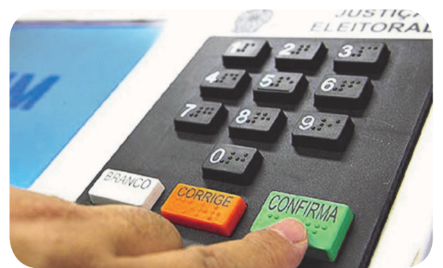
A Resolução traz prazos e proibições para todo o período eleitoral de 2026

A partir do dia 19 de setembro - 15 dias antes da realização do 1º turno -, candidatas e candidatos não poderão ser presos, salvo no caso de flagrante delito. Já eleitoras e eleitores não poderão ser pre-