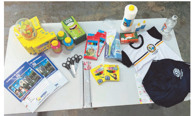
Os kits proporcionam mais igualdade de oportunidades entre os alunos

Para o prefeito Dr. Gleydson, investir na educação é fundamental para o desenvolvimento do município. “O compromisso com a educação