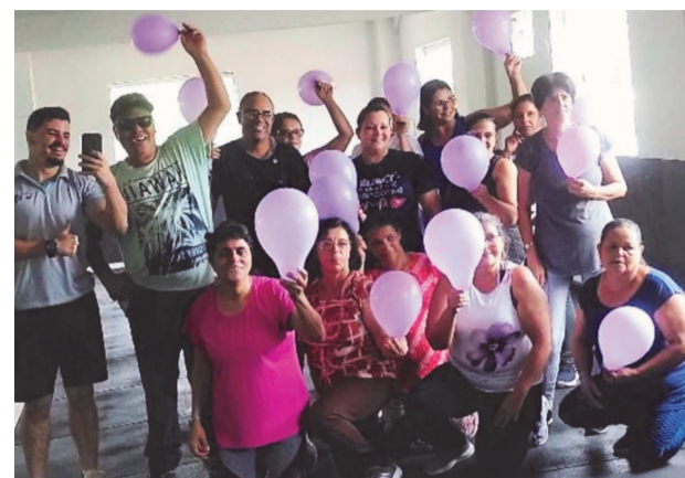
Março Lilás: cuidar da saúde também é prevenção!

Ele ressalta que, de acordo com especialistas