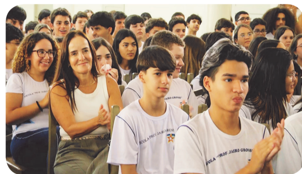
O evento reuniu alunos do Ensino Médio, professores e convidados