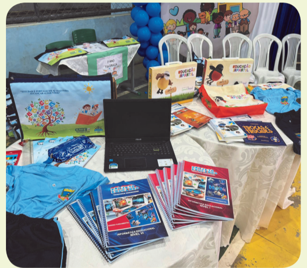
Todos os alunos das escolas municipais receberam os kits de material escolar

2º ano do Ensino Fundamental, são os materiais pedagógicos do sistema Aprende Brasil, ampliando os recursos educacionais disponíveis em sala de aula.