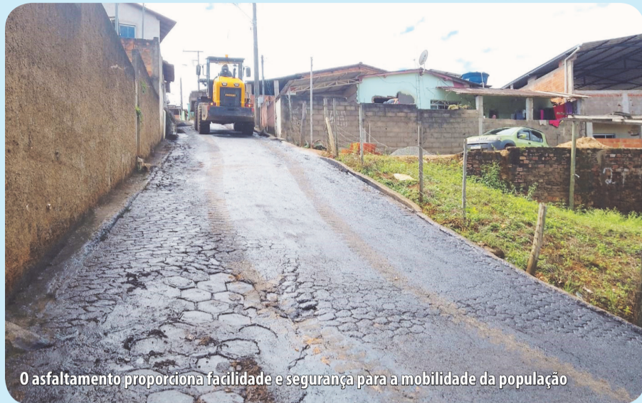
O asfaltamento proporciona facilidade e segurança para a mobilidade da população