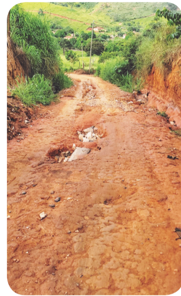
Córregos do Calixto e Mariano, entre outros, receberão calçamentos e redes pluviais