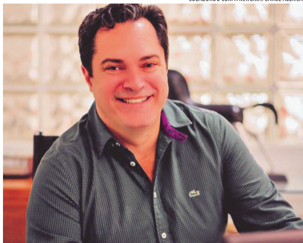
COLABOROU COM A MATÉRIA: CAROL ALENCAR

Como não poderia ser diferente, Ipanema já se prepara para a 16ª edição da tradicional Festa