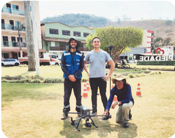
A equipe da Secretaria de Saúde se empenhou na elaboração do LIRAA

Assim sendo, com o índice de 5,8%, Piedade de Caratinga encontra-se acima do limite considera-