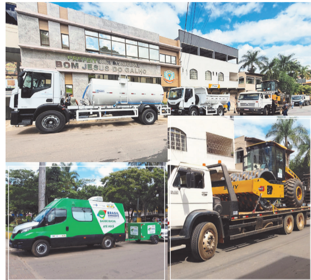
A nova frota representa enorme benefício para os serviços prestados pela Prefeitura

Ele também destacou que os novos equipamentos terão impacto direto na qualidade de vida da população. “Somos um município com extensa área rural, que depende de manutenção constante das estradas. Essa nova frota, sem dúvida,