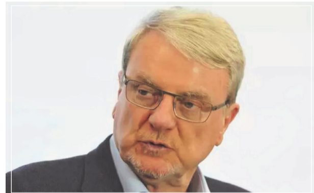
Márcio Lacerda, ex-prefeito de Belo Horizonte, palestrará no evento

ga, e escolas estaduais de 20 municípios da região. A entidade desenvolve capacitações, cursos e ferramentas para formar e municiar educadores, gestores e estudantes, estimulando ambientes escolares mais criativos, acolhedores e transformadores, nos quais o empreendedorismo é o pilar central para o desenvolvimento das competências e habilidades desenvolvidas pelos estudantes.