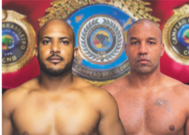
Vagner “Destroyer” X Neube Jacundino

Além da conquista pessoal, o atleta leva consigo o nome de Caratinga, fortalecendo o esporte local em âmbito nacional. Caso saia vencedor,