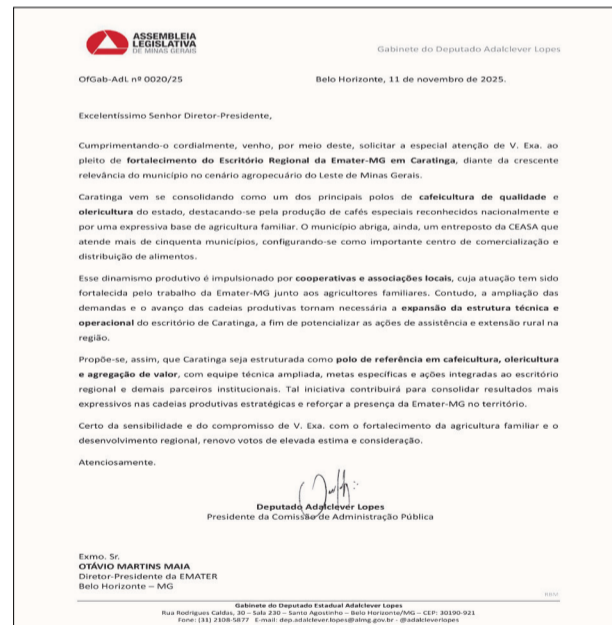
Ofício enviado ao presidente da Emater-MG pede unidade de apoio técnico em Caratinga