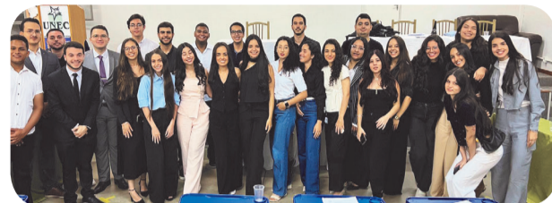
Acadêmicos do curso de Direito do Unec vivenciaram dos importantes momentos

fortalecimento do diálogo social, demonstrando como o Direito pode transformar realidades e promover equilíbrio em disputas complexas.