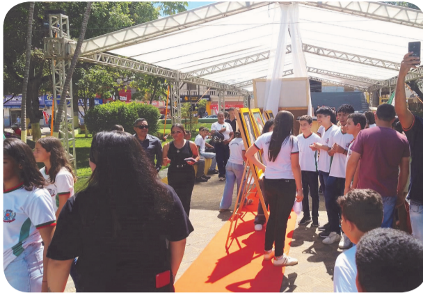
Durante os dois dias, a população visitou a estrutura montada para a Expo Art