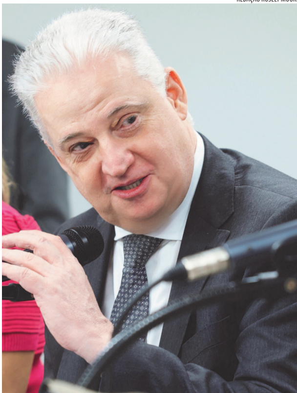
REDAÇÃO ROSELY MOURA

Como destaca o deputado, o estudo técnico analisa dois cenários, o que corroboram a solicitação feita por ele à Emater-MG. O primeiro cenário, que aponta a manutenção da sede regional da Emater em Ipatinga, tem como ponto principal o fato do órgão já contar com logística e patrimônio consolidados, o que evita custos altos com a mudança para Caratinga. Por sua vez, o segundo cenário, que propõe fortalecer Caratinga como polo técnico, permitiria a