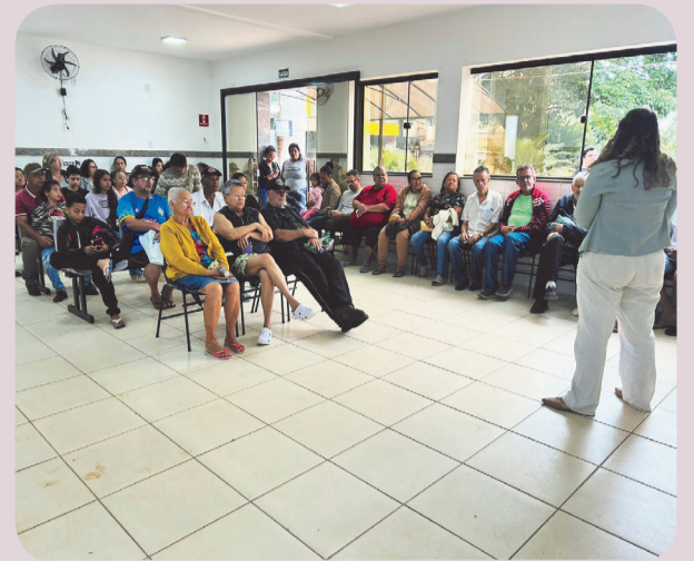
Durante suas palestras, a psicóloga procura tranquilizar e orientar aos pacientes

ton Alves, “a saúde mental na atenção primária é um pilar fundamental para o cuidado integral, pois a Atenção Primária à Saúde é a porta de entrada do sistema, próxima da comunidade e capaz