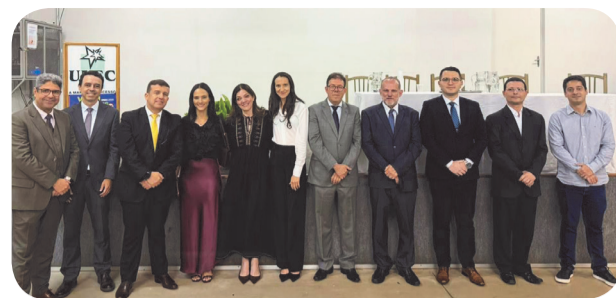
Profissionais de Direito prestigiaram a palestra do desembargador Newton de Carvalho

Com abordagem sensível e conectada à prática, o desembargador destacou o papel da conciliação na resolução de conflitos e no