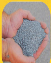
PÓ DE PEDRA