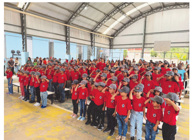
Uniformizados, os Bombeiros Mirins já mostram o aprendizado recebido

De acordo com a Secretaria de Educação, os pais ou responsáveis interessa-