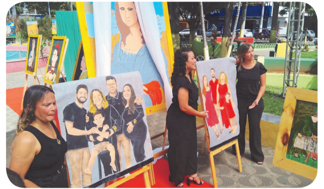
Familiares e o público puderam ver os quadros pintados pelos próprios alunos