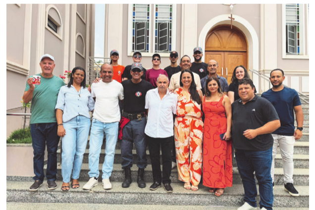
O prefeito Zé Rufino junto a pais e autoridades presentes ao evento

dos em inscrever seus filhos no projeto devem preencher o formulário disponível nas redes sociais oficiais da Prefeitura de Santa Bárbara do Leste, sendo que as novas vagas seguirão uma lista de espera.