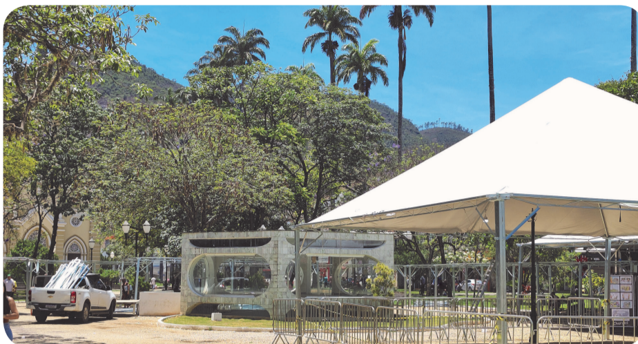
O mau uso e a falta de conservação contribuem com a degradação da praça

Para o Ministério Público, isso comprova que o descumprimento das obrigações pactuadas é evidente e exige imediata execução judicial e pede à justiça que a Prefeitura seja intimada a cumprir as