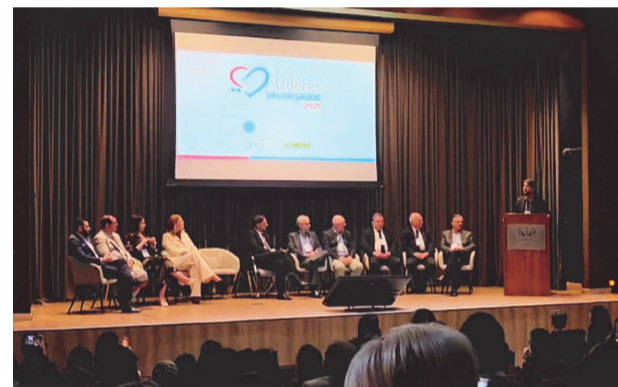
O evento reuniu importantes autoridades do setor de Saúde de Minas Gerais

De acordo com ela, a conquista representa um marco para Caratinga. “A partir de agora, especialmente com Caratinga como cidade polo e de gestão plena, passamos a ter a possibilidade de alcançar novas habilitações de alta complexidade, como já vimos conquistando ao longo do tempo. Esse reconhecimento é mais um instrumento que fortalece o hospital diante dos órgãos públicos, do Estado e também da União, em uma gestão compartilhada. O município passa a ter a oportunidade de se tornar uma macrorregião em Saúde”.