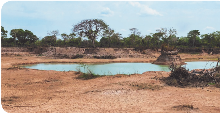
Fenômeno fez com que o semiárido mineiro fosse ampliado 450% em 36 anos

Ele informa que para a Superintendência do Desenvolvimento do Nordeste (Sudene), o fenô-