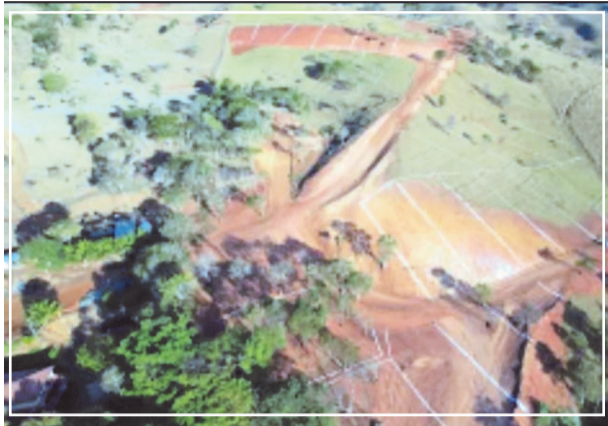
A área do Reserva Pôr do Sol atende a todas as exigências do setor imobiliário

O condomínio oferece área gourmet, salão de festas, playground e uma vista privilegiada para