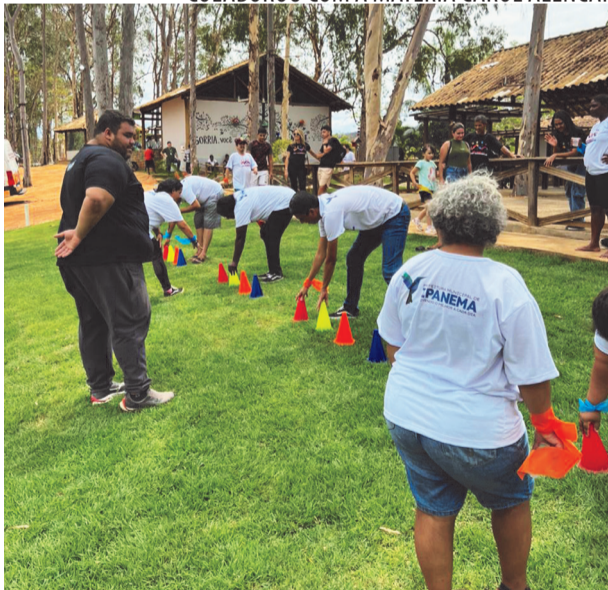
As atividades tiveram o objetivo de beneficiar a inclusão dos participantes

tram que a inclusão não está apenas nas palavras, mas nas atitudes. Ver o brilho nos olhos de cada participante é o que nos motiva a continuar investindo em políticas que garantam igualdade, respeito e oportunidades para todos”.