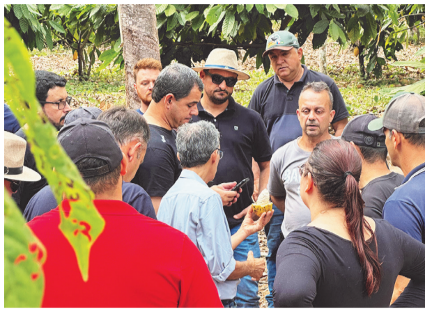
Os alunos conheceram na prática o processo de cultivo da seringueira e do cacau