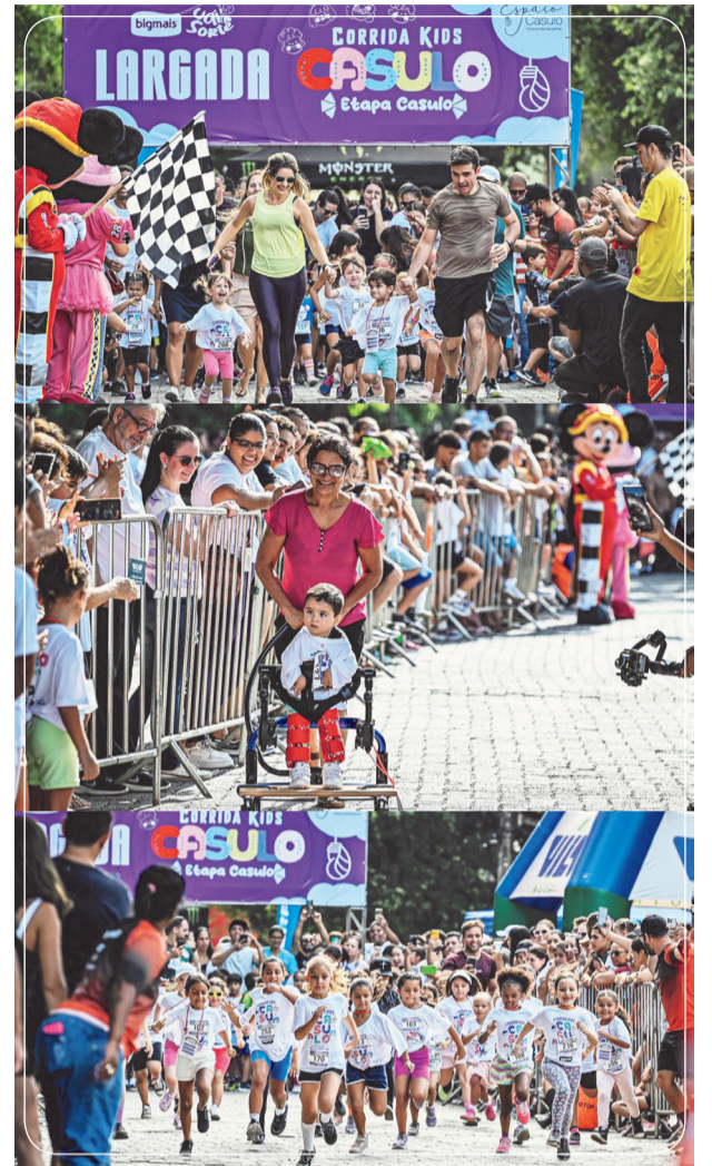
Corrida Casulo: Famílias celebram a força da Inclusão

Agora, os olhares se voltam para a segunda e última etapa da Corrida Kids Casulo 2025. A Etapa Borboleta acontecerá no dia 20 de setembro, às 16 horas, no bairro Lagoa Santa, em Governador Valadares. O convite está aberto a todas as crianças da cidade e região para mais um dia de movimento, diversão e inclusão. As inscrições para Etapa Borboleta podem ser feitas pelo link https://inscricaoecorrida.com.br/evento/corrida-kids-casulo-etapa-borboleta . Faltam poucas inscrições.