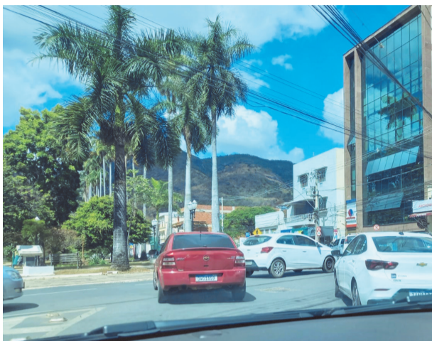
Trânsito de Caratinga: o caos que cresce e ninguém resolve

Um exemplo claro acontece no entroncamento conhecido como “Ponto Quente”, que conecta a Rua Marechal Floriano à Praça da Estação, Rua Lamartine e Rua Coronel Antônio da Silva (Rua