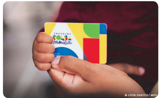
Beneficiários precisam atender convocação para evitar perder o Bolsa Família