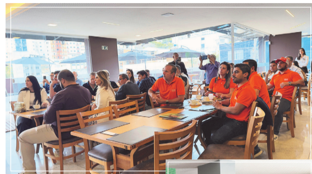
O evento reuniu corretores das principais imobiliárias de Caratinga

Segundo o empreendedor, além do Loteamento São José, o projeto contempla lotes em outras regiões da cidade, sendo disponibiliza-