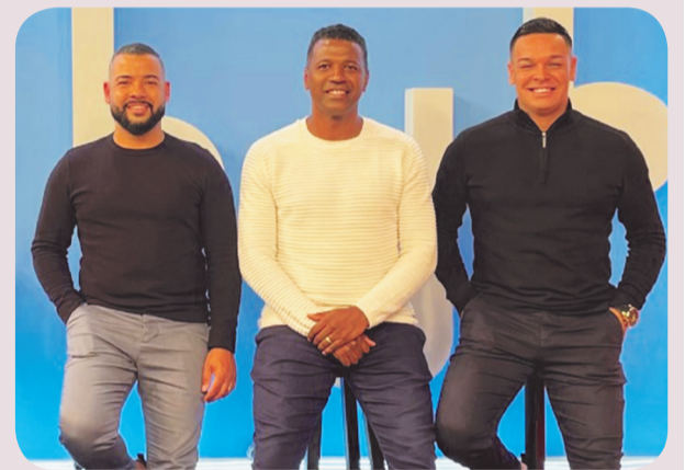
"COMMUNION: não importa onde estejamos, nossa missão é sempre a mesma - levar Jesus em cada gesto, palavra e atitude"