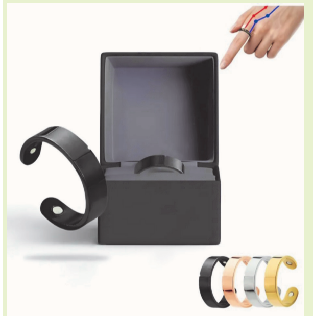
Segundo a Anvisa, a funcionalidade do produto não tem base científica

A Agência Nacional de Vigilância Sanitária (Anvisa) determinou na terça-feira, 02, a proibição de fabricação, importação, venda e uso de alguns medidores de glicose que prometiam avaliar níveis de glicose, oxigênio e até atividade cardíaca apenas com o uso de um anel, sem a necessidade de picadas no dedo.