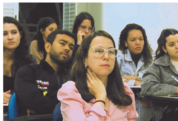
Estudantes e profissionais de nutrição participaram da Aula Inaugural

além do cumprimento das normas legais, representando responsabilidade e compromisso com o bem-estar da população. Ao trazer exemplos práticos do mercado, a especialista reforçou que o cuidado na fabricação e na comunicação ao consumidor deve ser compreendido como uma questão de saúde pública.