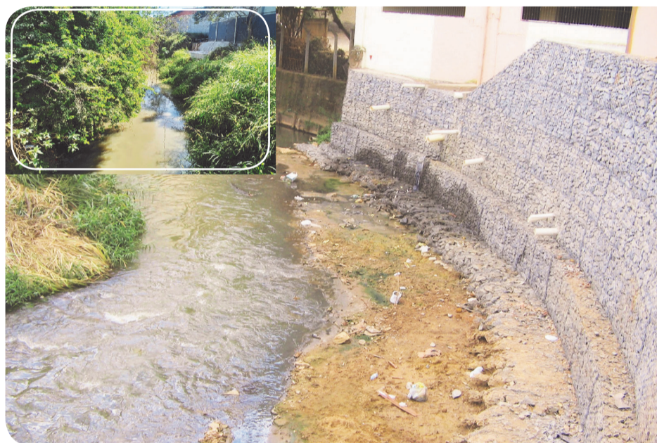
Mesmo ganhando obras, o rio Caratinga continua recebendo esgoto não tratado

ser confirmados pelo grande número de ações judiciais instalados em cidades onde ela atua. Confira algumas delas: