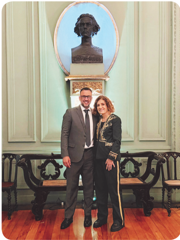
A jornalista Miriam Leitão com o presidente executivo da Rede Doctum, Pedro Leitão

A jornalista e escritora Míriam Leitão tomou posse na cadeira 7 da Academia Brasileira de Letras, em cerimônia realizada no Rio de Janeiro. Eleita em abril para suceder o cineasta Cacá Diegues, ela se tornou a 12ª mulher a integrar a instituição. Em seu discurso, Míriam ressaltou a paixão pelos livros e destacou a importância da representatividade feminina na Academia. Natural de Caratinga, ela soma mais de cinco décadas de carreira no jornalismo e é autora de 16 livros.