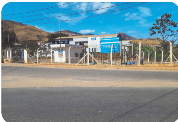
Estação de bombeamento no bairro Zacarias exala odor que causa reclamações dos moradores

De acordo com o artigo 5º da Lei Municipal 2.499, de 13 de novembro de 1998, que autorizou e orientou a formulação do contrato entre a Prefeitura de Caratinga e a Copasa, a empresa deveria realizar a implantação do sistema de