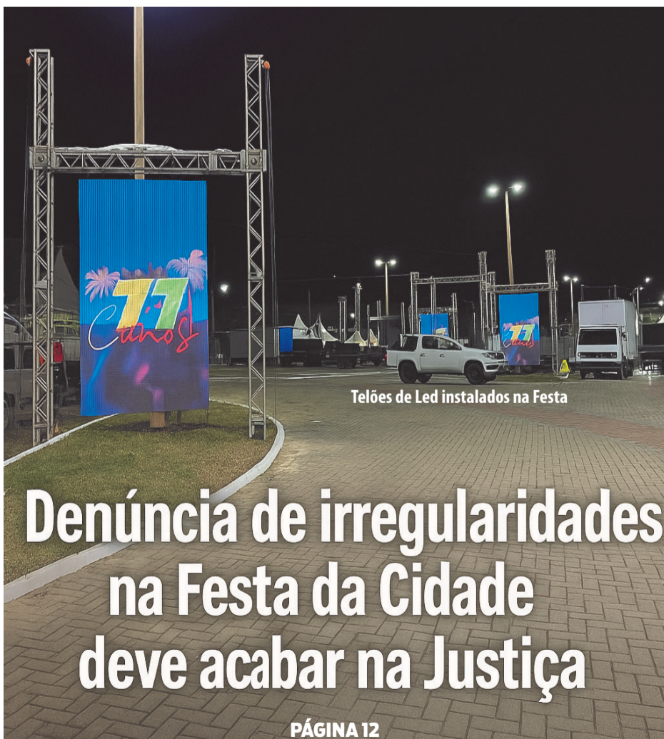
Telões de Led instalados na Festa

Denúncia de irregularidades na Festa da Cidade deve acabar na Justiça