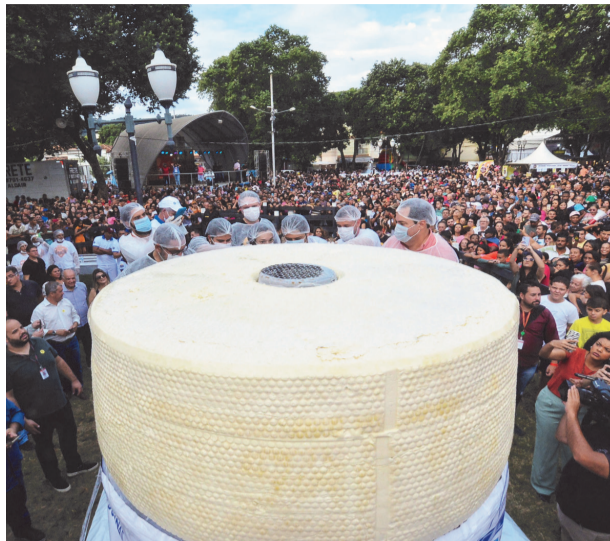
A expectativa é que o recorde mundial alcançado pelo queijo do ano passado seja batido neste ano