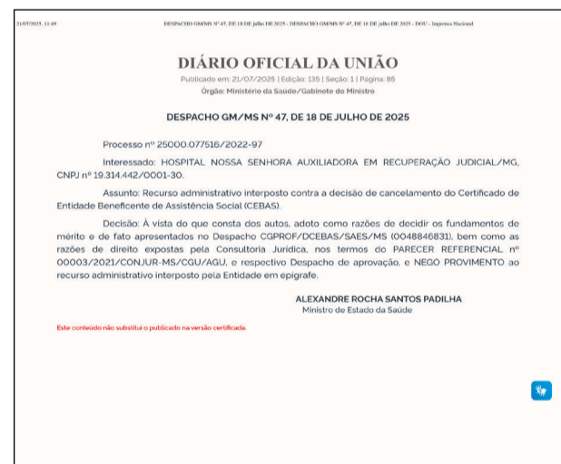
Através de despacho, Ministério da Saúde indeferiu recurso da direção do hospital

A partir de agora, com o cancelamento do Cebas, a tendência é a situação se complicar e o hospital passar a ter dificuldades em manter o seu funcionamento, voltando a enfrentar uma nova crise financeira que venha a possibilitar, até mesmo, o encerramento definitivo de suas atividades.