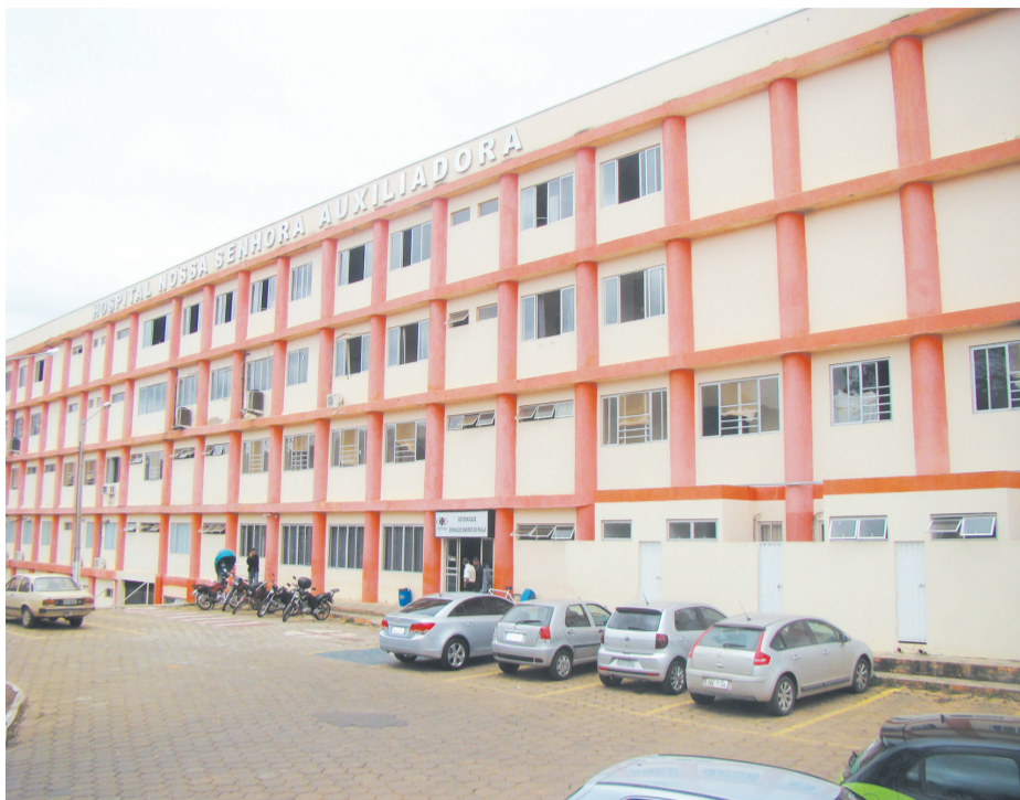
Hospital Nossa Senhora Auxiliadora (HNSA) poderá ter grave crise financeira

De acordo com a publicação do Ministério da Saúde, por meio do Despacho GM/MS 47, o recurso do Hospital Nossa Senhora Auxiliadora foi indeferido pelo não atendimento dos requisitos obrigatórios contidos para a manutenção do Certificado de Entidade Beneficente de Assistência Social, na Área da Saú-