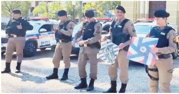
Militares durante o lançamento da operação Linha Segura em Caratinga

De acordo com a Polícia Militar, a operação se torna necessária devido ao aumento da prática de soltar pipas, sobretudo por crianças e adolescentes. Diante disso, a corporação reforçará a fiscalização e realizará ações de conscientização junto à população. As atividades envolvem o Policiamento Ostensivo Geral (POG) e o Comando de Policiamento Especializado (CPE), além do apoio de efetivos administrativos, que atuarão em áreas urbanas, rurais, unidades de pre-