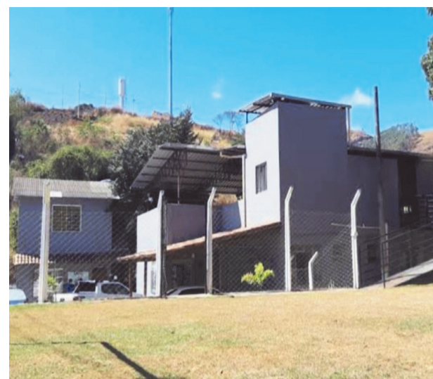
A Amac presta acolhimento a crianças e adolescentes desde 1996

Além do serviço prestado pela Amac, o município de Caratinga conta com o programa Família Acolhedora, que oferece uma alternativa ao acolhimento institucional, no qual crianças e adolescentes são recebidos por famílias previamente ca-