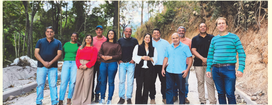
O prefeito Zé Rufino, vereadores e secretários visitaram os locais das obras