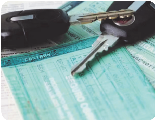
CRLV 2025 passa a ser exigido a partir de setembro. Fique atento!

O documento pode ser apresentado tanto na versão impressa quanto digital e está disponível nos seguintes canais: Site da CET-MG ( www.detrans.mg.gov.br ); Aplicativo Carteira Digital de Trânsito (CDT); MG App, aplicativo oficial do Governo de Minas Gerais. Para emissão da CRLV é