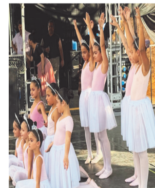
Balé coordenado pelo Cras emocionou o público com sua apresentação