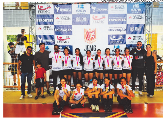
O Prefeito Júlio Fontoura participou da premiação dos atletas

Os bons resultados alcançados pelas equipes de Ipanema na etapa microrregional do Jemg são frutos do trabalho contínuo e comprometido com o desenvolvimento do esporte, a partir do empenho da Prefeitura de Ipanema, que vem investindo de forma consistente em infraestrutura, capacitação de profissionais e incentivo à formação de atletas por meio de escoli-