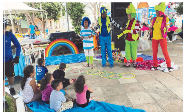
O Passeio Ciclístico foi marcado por apresentações e orientação sobre Saúde