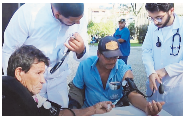
As pessoas tiveram acesso a aferição da pressão arterial e verificação da glicemia

A iniciativa também contou com a participação de alunos do curso de Enfermagem, promovendo a atuação interprofissional e fortalecendo a prática do cuidado em saúde pública por meio do trabalho em equipe. De acordo com os organizadores, o envolvimento de diferentes áreas da saúde