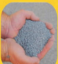
PÓ DE PEDRA