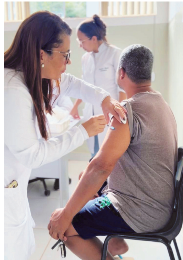
A vacinação acontece em todas as Unidades de Saúde de Piedade

A Prefeitura reforça o chamado para que todos que ainda não se vacinaram procurem a unidade de saúde mais próxima. A vacinação é