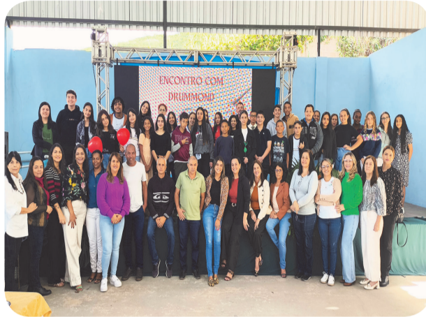
A atividade reuniu os profissionais de Educação das escolas de Santa Bárbara

Durante a programação, alunos das redes estadual e municipal recitaram e encenaram poesias de Carlos Drummond, proporcionando momentos de emoção e reflexão. As apresentações foram muito elogiadas e evidenciaram o talento e o envolvimento dos estudantes com a pro-