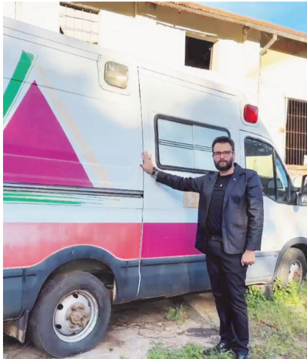
Durante fiscalização, foram identificados nove veículos parados há anos, incluindo ambulâncias e carros da Secretaria de Saúde

O vereador também destaca uma van Renault, ano 2020, pertencente à Secretaria Municipal de Saúde, que está parada há quase