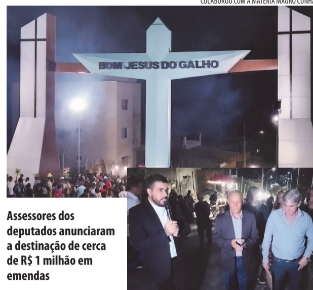
Assessores dos deputados anunciaram a destinação de cerca de R$ 1 milhão em emendas