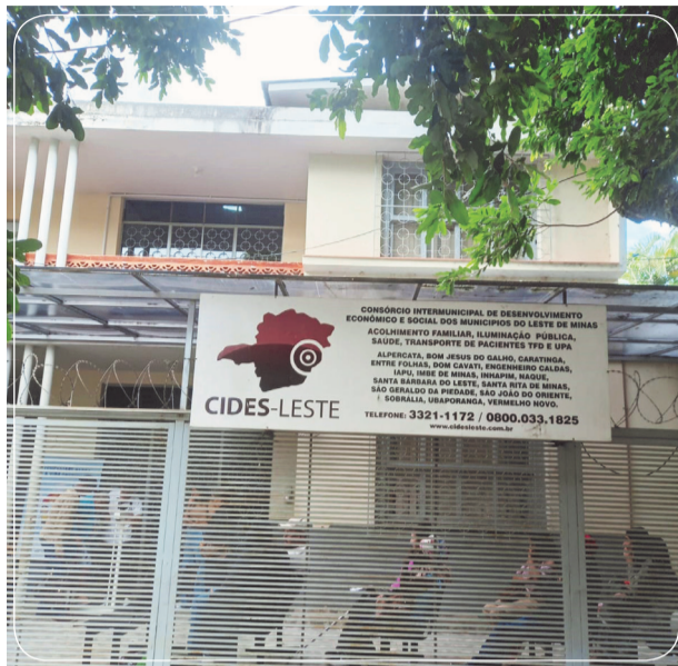
Inquérito visa apurar denúncias de irregularidades no consórcio

Porém, como destaca o denunciante, uma semana após a Operação Forasteiros, realizada pela Polícia Civil no dia 24 de março, visando