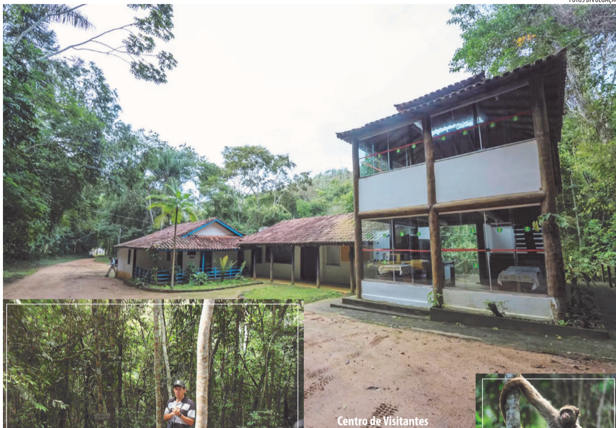
Centro de Visitantes

Vale citar que a pesquisa ininterrupta do