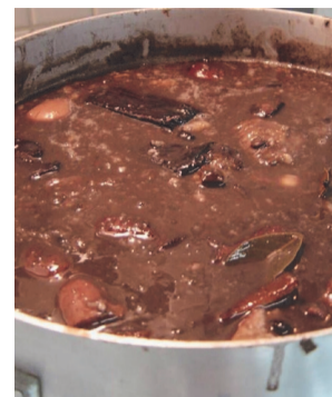
A Feijoada Beneficente é um dos meios de arrecadação de recursos para o Lar dos Idosos

É importante ressaltar que o funcionamento e o excelente atendimento oferecido pelo Lar dos Idosos Monsenhor Rocha aos seus assistidos têm como principal base de sustentação as doações feitas por empresas, instituições e pela população. Quem deseja tornar-se um doador ou realizar doações esporádicas devem entrar em contato com a entidade. As doações também podem