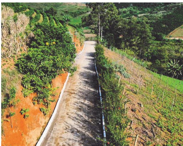
As melhorias realizadas garantirão mais facilidade e segurança no escoamento da produção