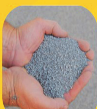
PÓ DE PEDRA